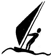
la planche à voile